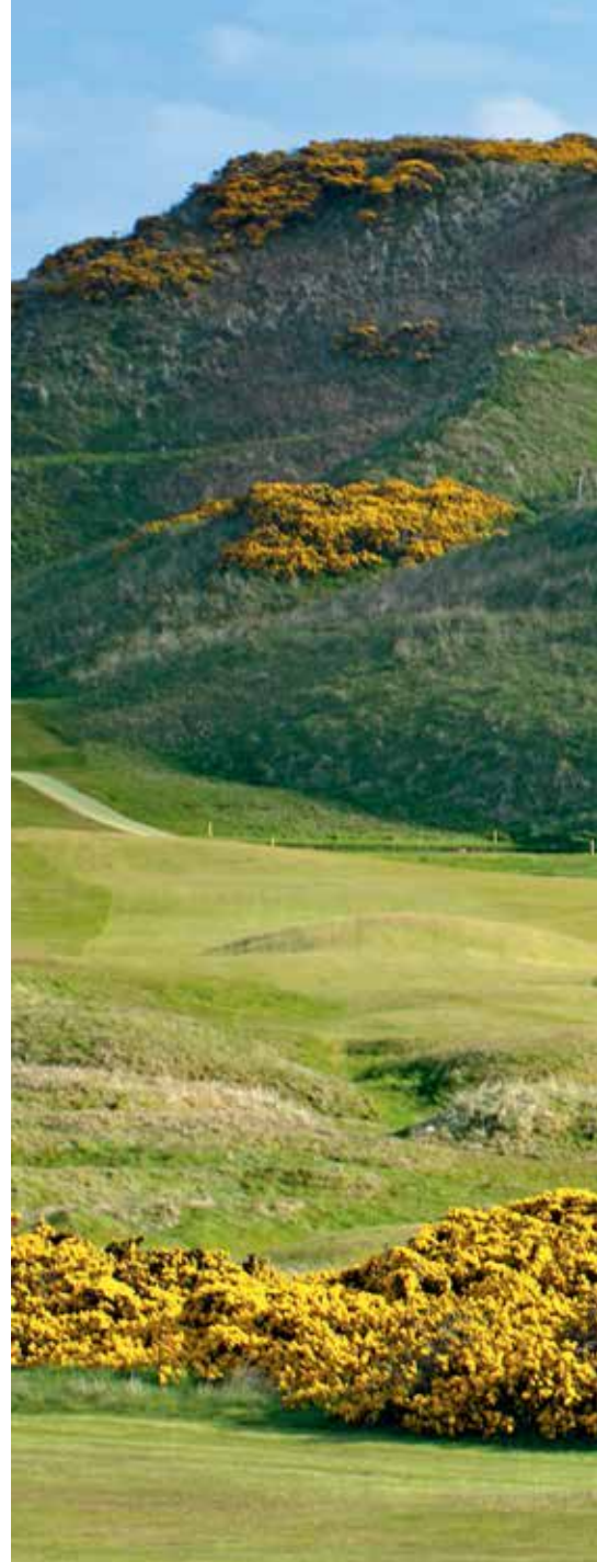
Cruden Bay, skapad av någon med sinne för detaljer.

L ängs trådsmla, gräsbevuxna vägar i Somerset, Devon och Cornwall inleder vi vårt sökande. Blommande trädgårdar, hagtornshäckar och milslånga stränder. Här söker man även den ultimata vägen – surfing i Cornwall. Precis som många har kopplat samman själen med linksgolf är surfing och själ ETT i denna havsnaturreligion. Man kan likna det vid flow – en upplevelse som skapar en stark lyckokänsla och lyfter individen till en högre nivå. Det är det vi söker. På West Cornwall spelar vi i dimman i kanten av en övergiven medeltida kyrkogård – längs St. Ives Bay. Det är stora sanddynor, smalt och