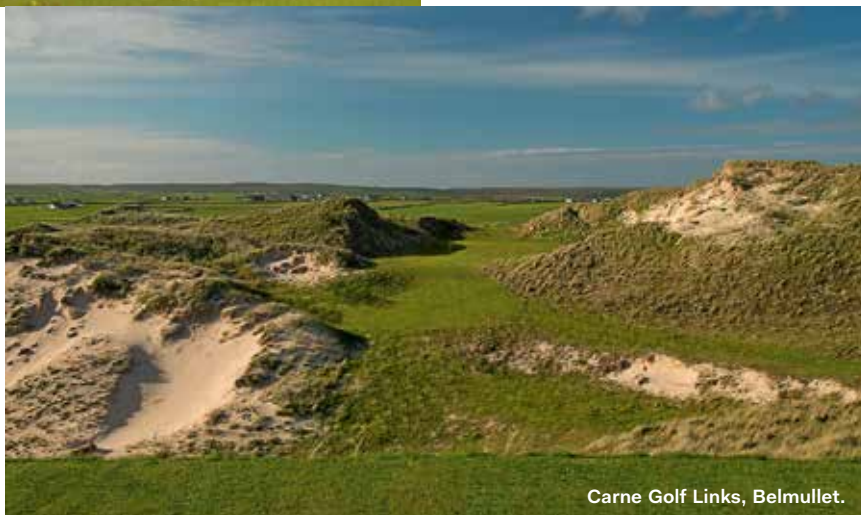
Carne Golf Links, Belmullet.

Medan vi åter vår Gammon Steak with cut chips går tankarna åter till 1974 – men den här gången till Hunstanton GC. Robert