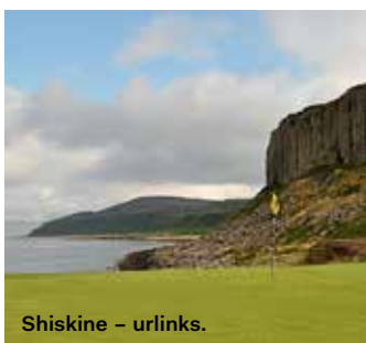
Shiskine – urlinks.

En del linksbanor hänger på kanten av en hög avsats innan havet nås. I detta glapp mellan turf och strand finns glappet i linksens definition – men det är självklart turfens beskaffenhet som avgör detta och inte höjden över havet. Exempel – Pennard och Sheringham.