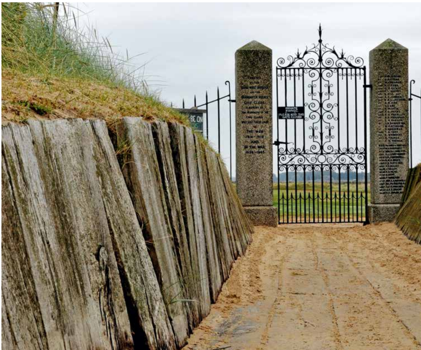
Royal West Norfolk, privat och svåråtkomlig även för Bill Gates.

– med art deco-smycket Saunton Sands från 1937 på höjden ovanför Braunton Burrows. Det var här som Pink Flyod ställde upp alla sjukhussängarna på sitt skivomslag 1987 och även gjorde delar av filmen till The Wall . Inspirerade tar vi oss ut på banan där Pennink vann British Amateur 1937 – mellan sandkullarna har tidens arkitekter låtit varje fairway långsamt slingra sig fram. På 15:e hållet möter vi en sökare från en annan värld – Hugh Grant – vi delar plötsligt fairway, hälsningsfras och en obesvarad kärlek till links.