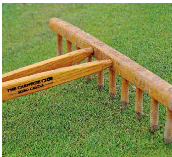
"Vi bygger ett sandslott".

Det finns platser där naturliga linkskluster har skapats – sanddyner och ett genuint golfintresse är två grundkomponenter. Den tredje är järnvägen. Liverpool, Crosby and Southport Railway öppnade rälsen 24 juli 1848, med stationer som Formby, Hillside och Birkdale. Klassiska links som lockar med à la carte. Formby bjuder upp till dans redan i sitt klubbhus tillika dormy. Vi stannar över natten, mörkrädda som små barn vaknar vi i givakt till greenklipparens dova muller. Klappar försiktigt den uppstoppade flodhästen och sätter