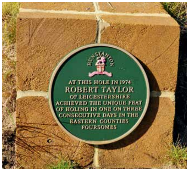
40 år senare.