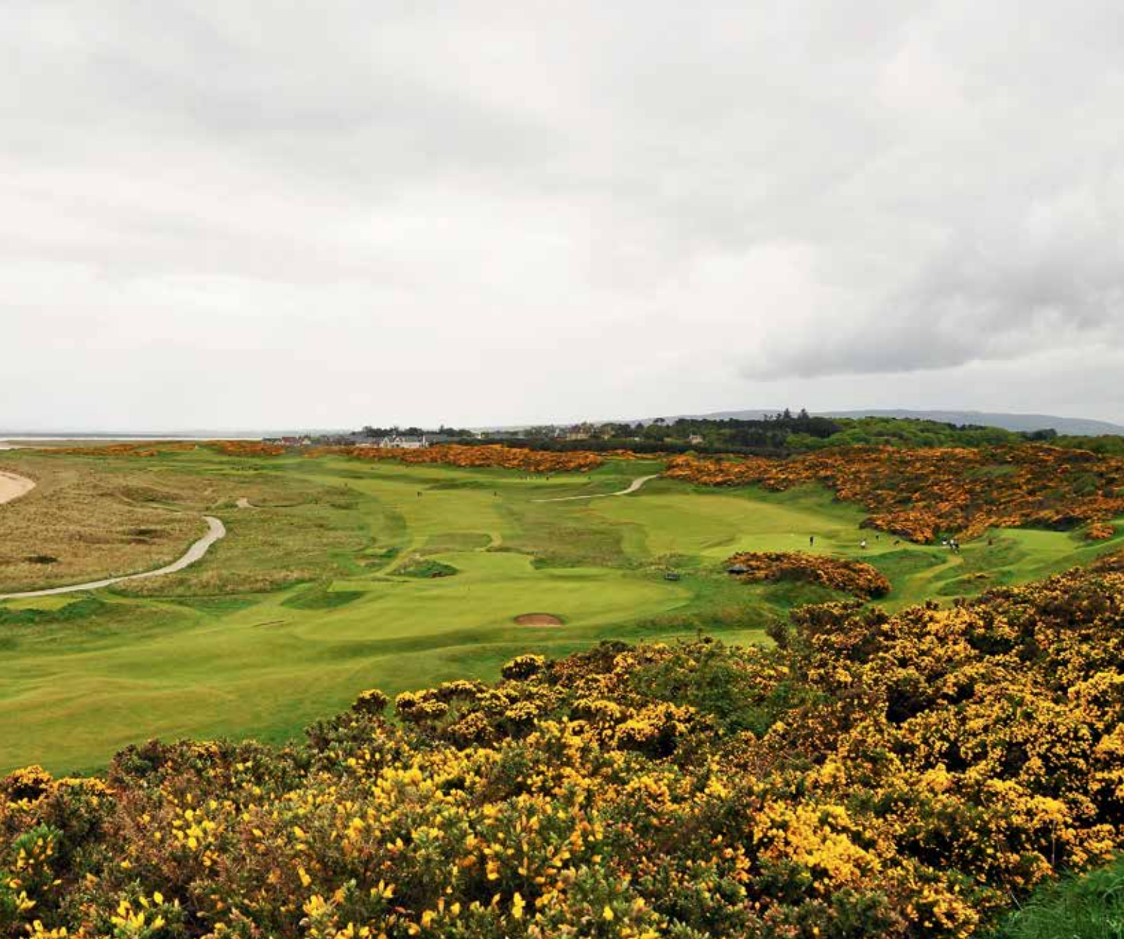
Även Donald Ross trivdes på Royal Dornoch i Inverness, Skottland.

i oss. En "rugged" links med självförtroende och karaktär. Hål 14 – Whins – med äkta badkarsgreen – sann linksglädje!