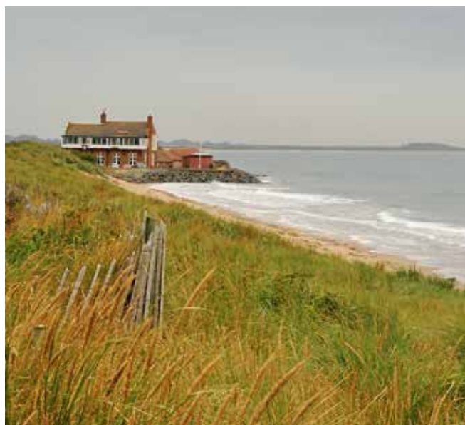
Norfolks skönaste landmärke.

Eller som det står i banguiden "Par is considered to be an excellent result on this hole." Länge ska draken från Borth hemsöka oss i mardrömmen.