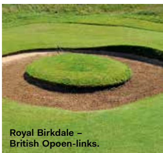
Royal Birkdale – British Opoen-links.

Exempel – Prestwick och Royal North Devon.