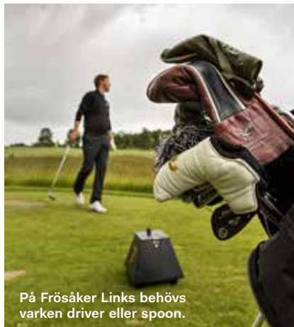
På Frösåker Links behövs varken driver eller spoon.

Det är som att åka skidor i lössnö. Man ska ta sig ner. Man vet inte hur.