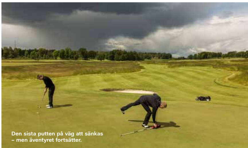
Den sista putten på väg att sänkas – men äventyret fortsätter.

på resan med Links 75, dessutom med den berömda fyren och klippön Aisla Craig på fotografen Brian Morgans omslagsbild.